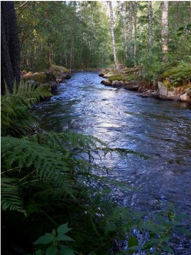
Kärnäkoski laskee Saimaaseen vanhan myllyn alapuolella.