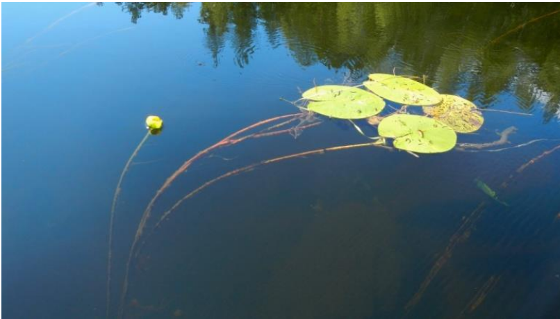
Ulpukka virtaan taipuneena.