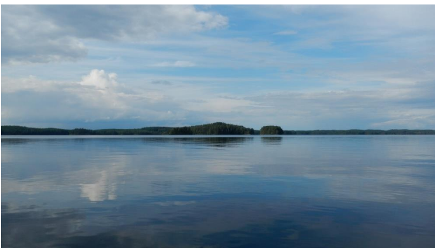
Ulapalla mieli lepäsi.