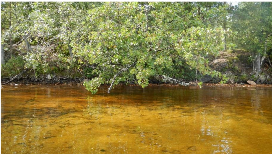
Yllä rantahiekkaa Pienen Säkniemen edustalla.

Kävimme elokuussa melomassa parina päivänä eri puolilla Kuolimoa ja se oli kyllä ihana kokemus! Parasta oli täydellinen hiljaisuus ja rauha järvellä. Ensimmäisenä päivänä lähdimme melomaan Lepänkannon rannasta, jonne kanootin saa vietyä helposti autolla. Lepänkanto on upea hiekkaranta lähes Mikkelintien varrella, noin 7 kilometrin päässä Savitaipaleelta. Lepänkannon pitkä, matala hiekkaranta oli kivaa katseltavaa. Puut kumartuivat hienosti veden ylle ja pohjalla vaihteli kivikkoiset ja sileämmät kohdat, satunnaisine nuottaruohoineen. Kivikoissa näkyi myös kotiloja.