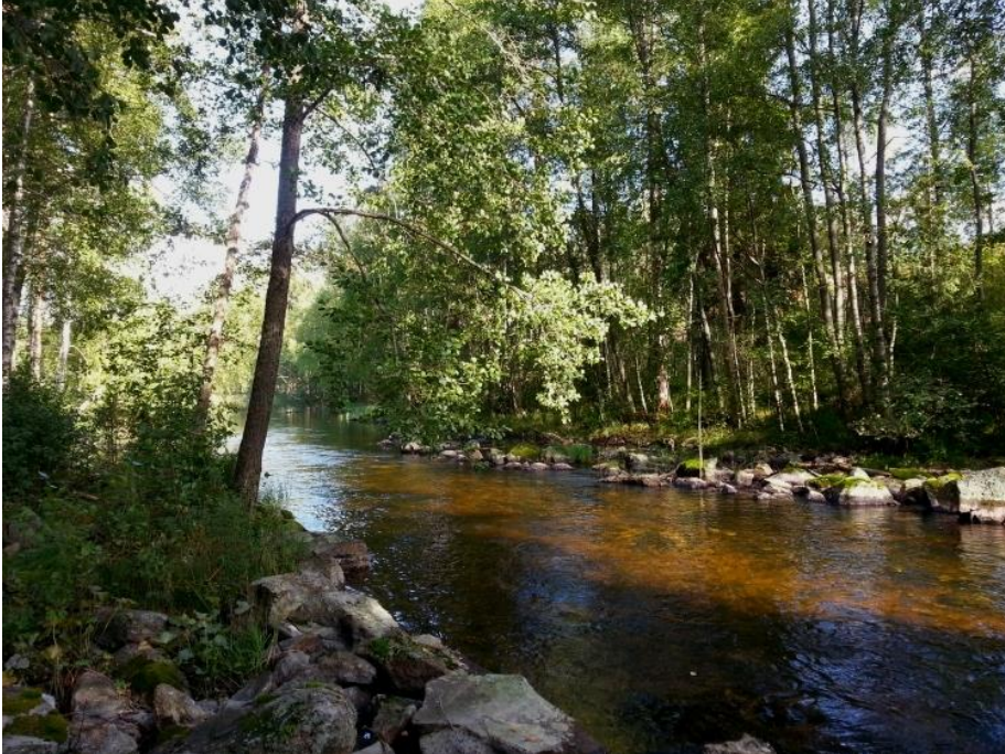
Kärnäkoskea Raimlahdelta alavirtaan.

Kirkkaan veden ansiosta meloessa oli helppo ihaila nättisti pohjaan asti näkyviä vesikasveja, kiviä, puunrunkoja ja kalojakin. Erityisesti minua ilahdutti nähdä järvisientä yläjuoksun kivikoissa. Nuottasaarelta takaisin meloessa pysähdyimme Kärnäkosken laavulle syömään eväitä. Tästä laskimme hiljakseen alavirtaan takaisin sillalle ja nostimme kanootin vedestä ennen suurimpia kuohuja myllyn alapuolella. Ennen Kärnäkosken siltaa huomasimme kivikoissa myös järvisimpukoita.