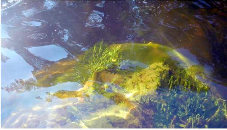
Järvisientä Kärnäkoskessa kivellä.