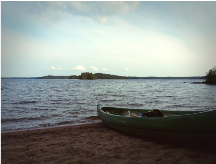
Inkkarikanootti Suomensalon rannassa.

Meloimme rantoja myöten Lepänkannosta Säkniemen ympäri Rovastinojalle ja siitä Sianniemen kautta Suomensaloon. Säkniemessä Saunalahdella on huikkeissa maisemissa Savitaipaleen seurakunnan leirikeskus. Kuolimon etelärannalla voi ulkoilla Jääkauden jäljet – reitillä, joka vie Rovastinojalle. Rovastinoja laskee Rajalamminsuolta Kuolimoon. Rovastinojalla voi patikoinnin ohessa ihastella vanhoja jäänteitä kivikauden asutuksesta sekä pysähtyä kivikauden tyyliin rakennetulle laavulle.