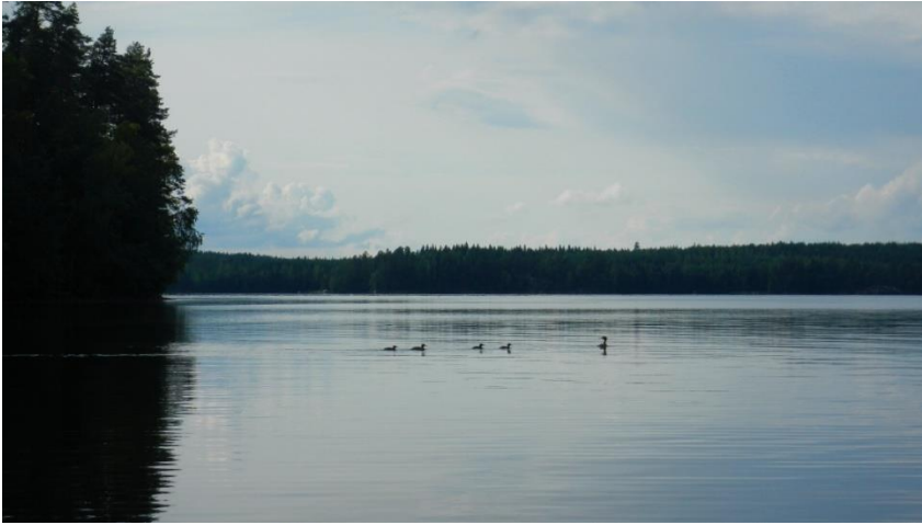
Tukkakoskelonaaras palasi rannalta järvelle poikueineen.